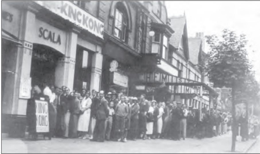
[Ffotograff o Sinema'r Scala ym Mhrestatyn, Gogledd Cymru, yn 1938]

Astudiwch y ffotograff isod ac yna atebwch y cwestiynau sy'n dilyn.