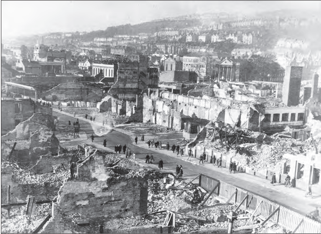
[Ffotograff o ganol dinas Abertawe yn 1948 ar ôl diwedd yr Ail Ryfel Byd, yn dangos y difrod a gafodd ei achosi gan y Blitz]

Astudiwch y ffotograff isod ac yna atebwch y cwestiynau sy'n dilyn.